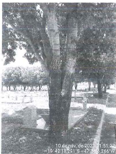
Figura 1: Oitizeiro com casca inclusa.

Sendo assim, estes técnicos recomendam a supressão do oitizeiro, o desmonte do espécime morto e a retirada do limoeiro. Diante disso, encaminhamos o presente Relatório Técnico, bem como a respectiva autorização de supressão e destoca para a Secretaria de Serviços Urbanos e Obras para execução.