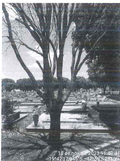
Figura 2: Espécime morto.