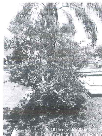
Figura 3: Limoeiro.